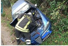
Perde il controllo dell'auto e si ribalta, con a bordo i suoi 4 figli: paura sulla...