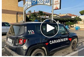
Trans trovato morto in hotel a Tor San Lorenzo: 35enne arrestato per...