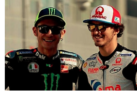
MotoGp, a Valencia anche Valentino Rossi per tifare Bagnaia