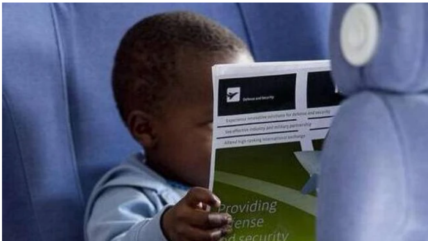
Bimbi adottati in arrivo dal Congo

Roma, 11 novembre 2021 - E' stato pubblicato in Gazzetta Ufficiale il 4 novembre 2021 il decreto del ministro per le Pari Opportunità e la Famiglia, Elena Bonetti, che prevede il rimborso delle spese sostenute per